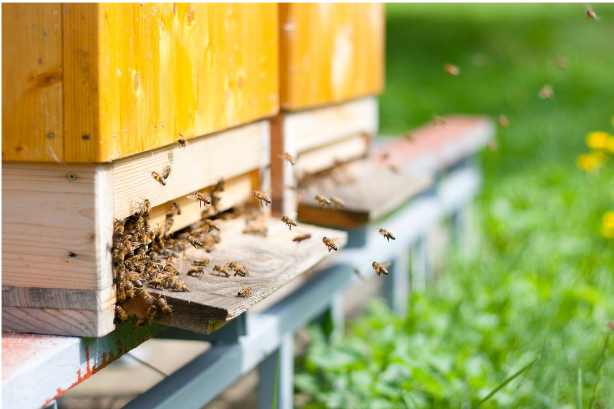
Abbildung II: Bis Honigbienen im Frühjahr wieder ausfliegen, können neun Monate Winterfütterung nötig sein. ii

Empfehlungen, die sich aus den genannten Anforderungen an Futtermittel für Honigbienen hinsichtlich der Herstellung, des Transports, des Handels und für den Imker ergeben, werden unter Punkt 4 aufgeführt.